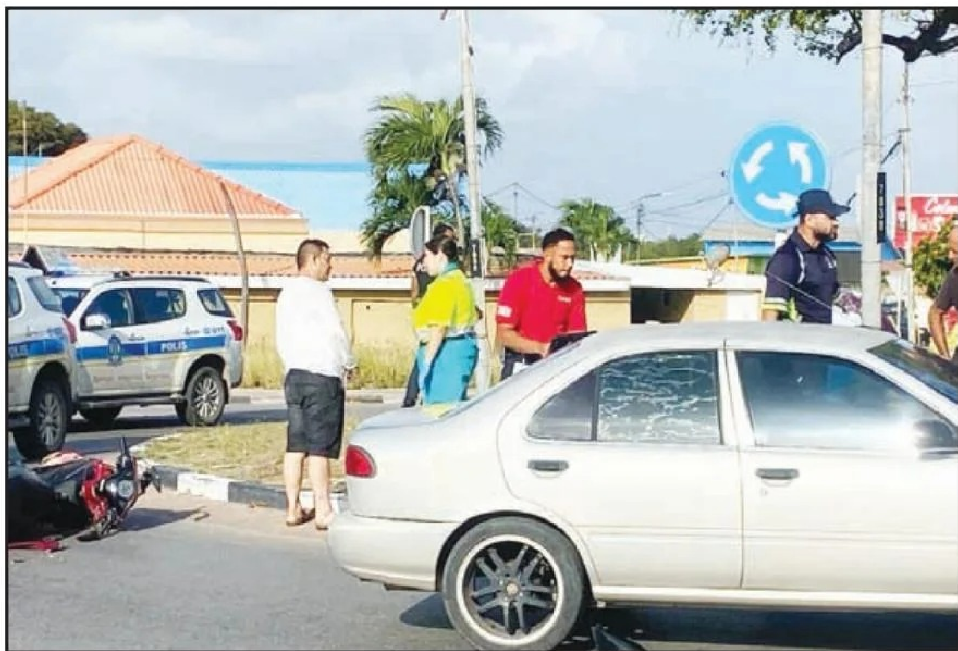
Diaranson mainta a drenta informe di un accidente cu hende herida na e rotonde Sero Blanco, mesora a

dirigi tanto polis como ambulans na e sitio. Na yegada di e patruya a bin compronde cu aki ta trata di un accidente entre un auto y un scooter cu declaracionnan contradictorio unda e automobilista ta bini di pazuid y e scooter tambe pero segun e motociclista e ta bini di pabao. debi na e impacto e motociclista a resulta herida. Na yegada di e ambulans